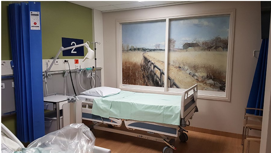
Traumatologian osasto, potilashuone. Elin Danielson-Gambogi: Ruissalon silta, 1891, öljy kankaalle, 29x46cm. Kansallisgalleria/Ateneumin taidemuseo.