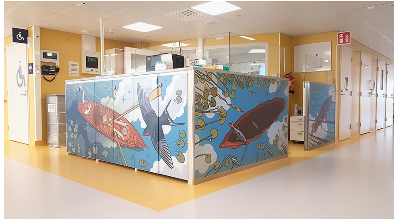
Neurokeskus, hoitaja-asema. Pentti Otsamo: Soutelijat, 2020.

Henna Hietainen henna.hietainen@pshyvinvointialue.fi 044 711 3065