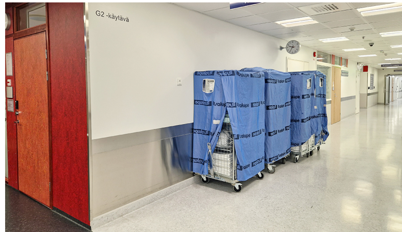
Kari Juutilainen: Pyörre vastapäivään, 2015.