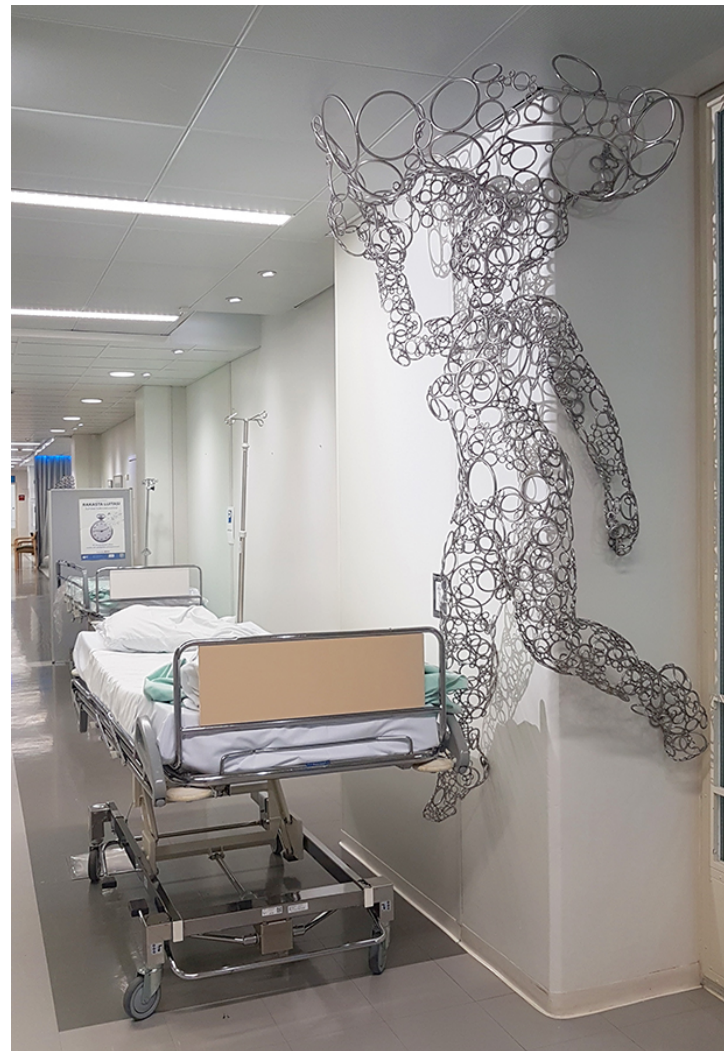
Antti Immonen: Höyrypää, 2017.