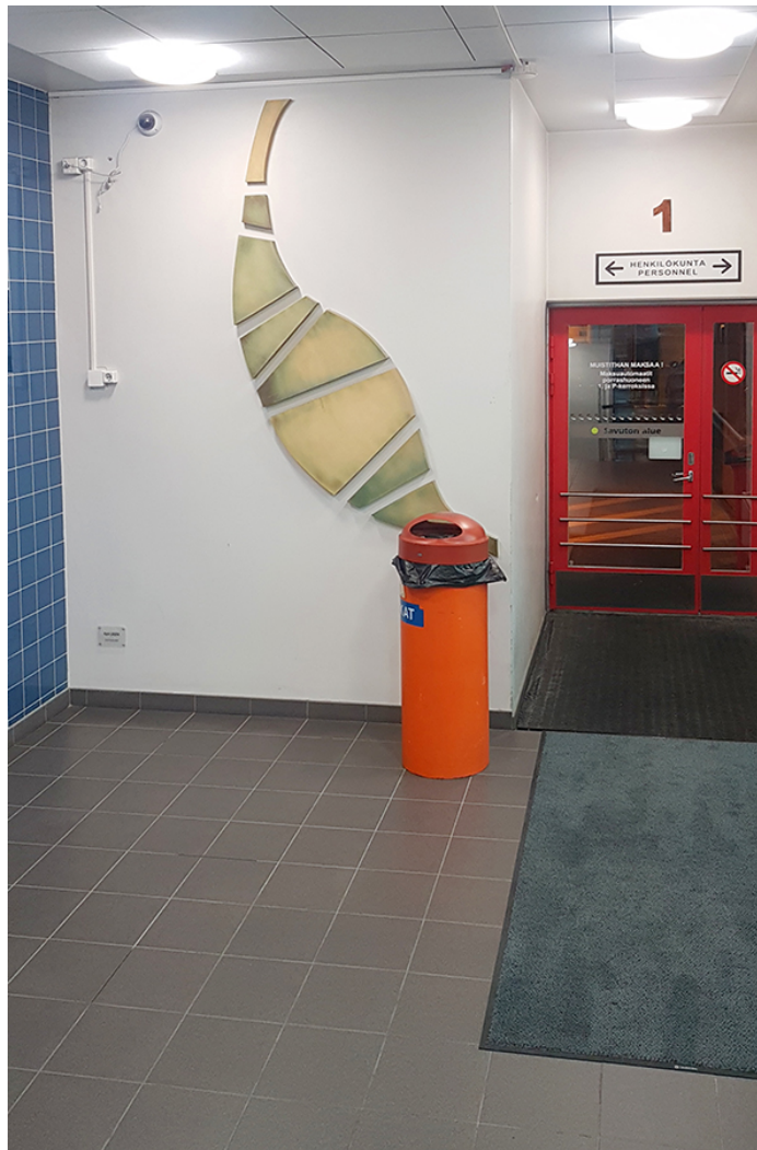
Kirsi Puonti: Ajan jäljillä, 2006.