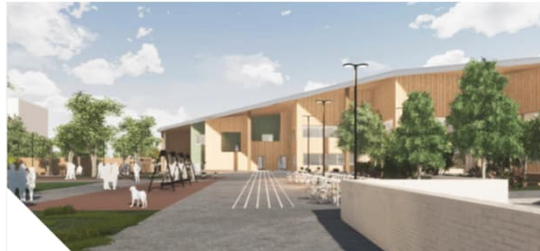
2022 Helsinki Puotilan koulu