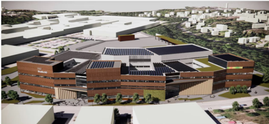
2026 Helsinki STAO Roihupelto Ammatti- ja aikuisopisto - 44 000bm 2 - 4500 opiskelijaa