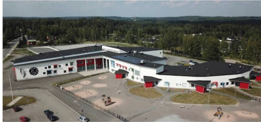
2016 Hämeenkyrön monitoimikeskus Silta