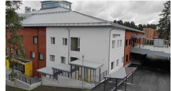
2022 Siilinjärven terveystakeskus